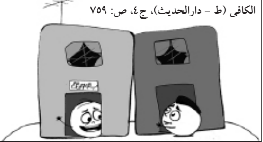
الکافی (ط - دارالحدیث)، ج ۴، ص: ۷۵۹

از یک نذری شروع کن. حتی اگر یهودی است، شله‌زرد رمضان را به او هم بده. از این‌جا که شروع کنی، به جایی می‌رسی که شب سرت را زمین نمی‌گذاری مگر این‌که بدانی همسایه‌ات سیر است.