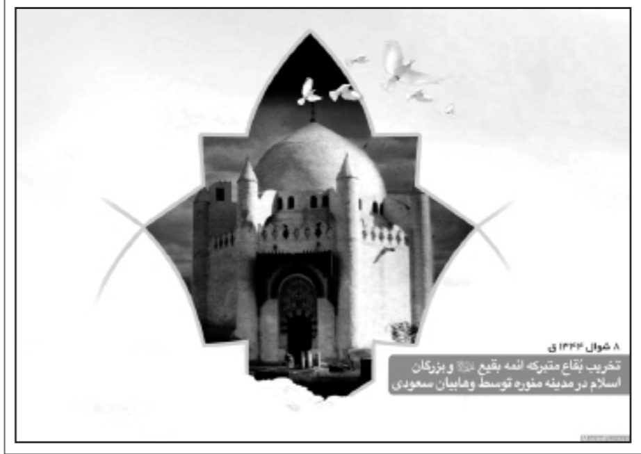
۸ سوال ۱۴۴۴ ق تخریب بقاع متبرکه ائمه بقیع عَلَيْهِمُ السَّلَام و بزرگان اسلام در مدینه منوره توسط وهابیان سعودی

• در این بخش می‌توانید طرح‌های مناسبی این هفته را مشاهده کنید. برای این هفته در تارنمای masjednama.ir پوسترهایی با موضوعات: تخریب بقاع متبرکه ائمه بقیع عَلَيْهِمُ السَّلَام و بزرگان اسلام در مدینه منوره توسط وهابیان سعودی قرارگرفته است.