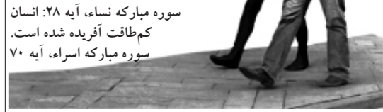
سوره مبارکه نساء، آیه ۲۸: انسان کم‌طاقت آفریده شده است. سوره مبارکه اسراء، آیه ۷۰

«خلیفه خدا» اولین شریعت را آورد تا من و تو آن را انتخاب کنیم و مانند او از فرشتگان هم بالاتر رویم. پس ای فرزند آدم، بکوش که «آدم باشی»!