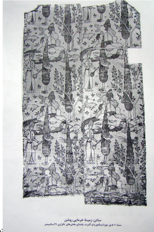
تصویر ۱۱ ساتن با نقش سرو طبیعی