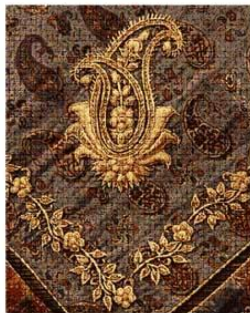
تصویر ۱۳ بته جقه سرمه دوزی عکس از آرشیو نگارنده