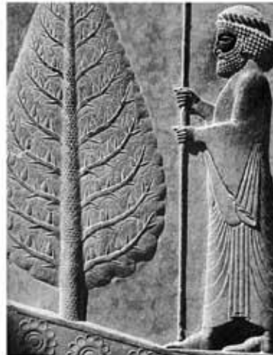
درخت سرو در سنگ نگاره های تخت جمشید

تصویر ۴ منبع: www.drshahinsepanta.blogspot.com تاریخ مراجعه: ۸۸،۹،۲۵ تصویر ۵ منبع: کتاب هنر ایران، ص ۳۳