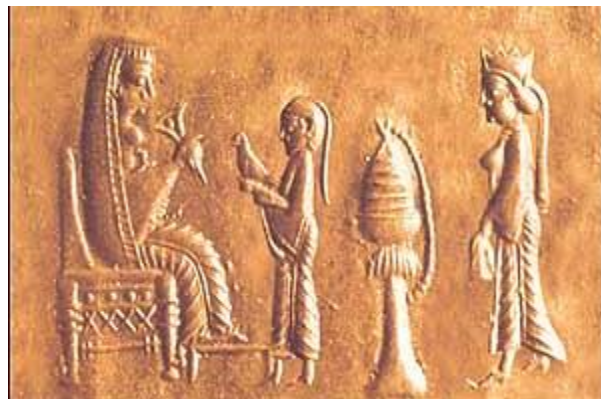
تصویر ۳ اثر یک مهر هخامنشی که در موزهی لوور فرانسه نگهداری می‌شود