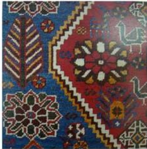
سرو ایستاده با شاخه‌های افقی در نقش قالی‌های عشایر