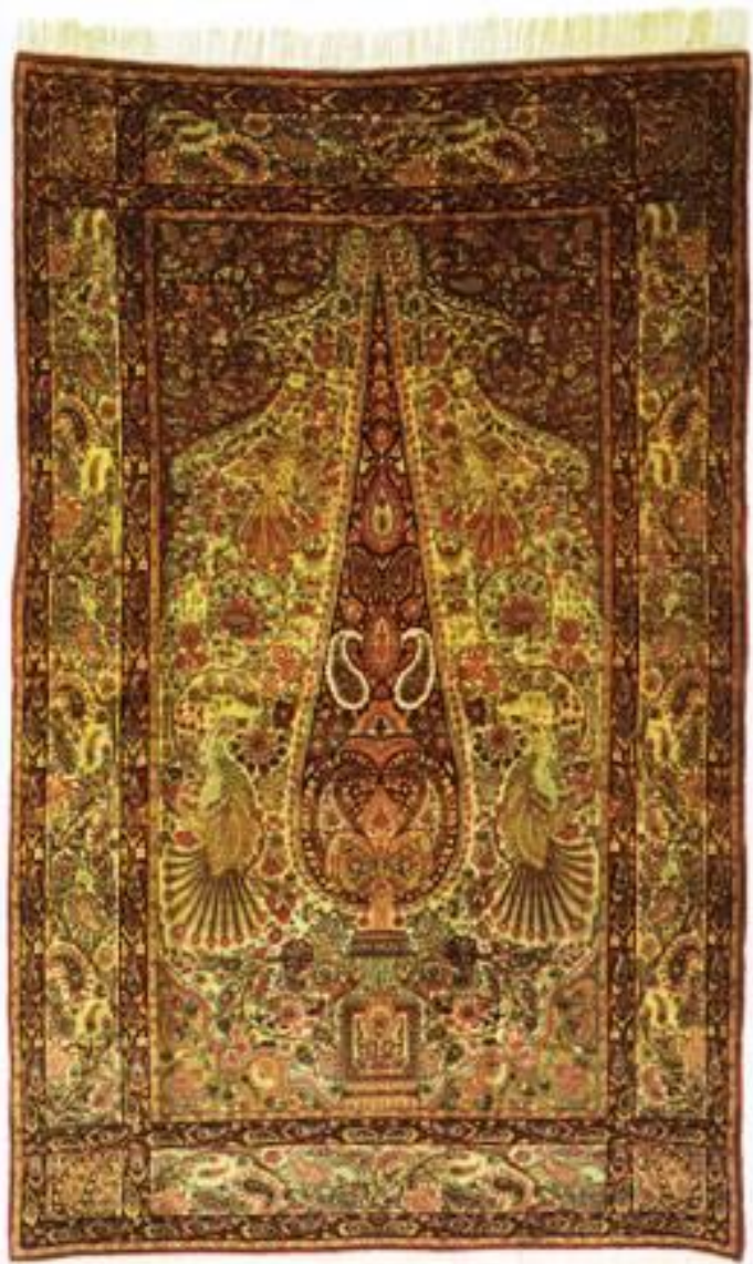
تصویر ۸ درخت سرو در قالی کرمان با نقشه درختی منبع: www.drshahinsepanta.blogspot.com تاریخ مراجعه: ۸۸،۹،۲۵