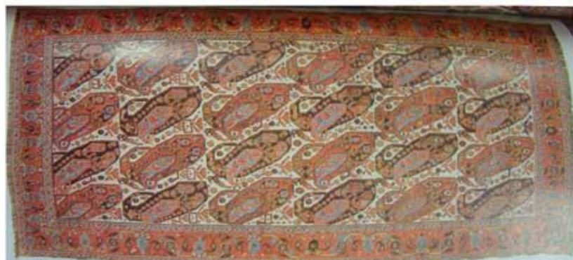
تصویر ۹ قالی بانقش درخت سرو به شکل انتزاعی (هنر ایران ص ۱۳۸)