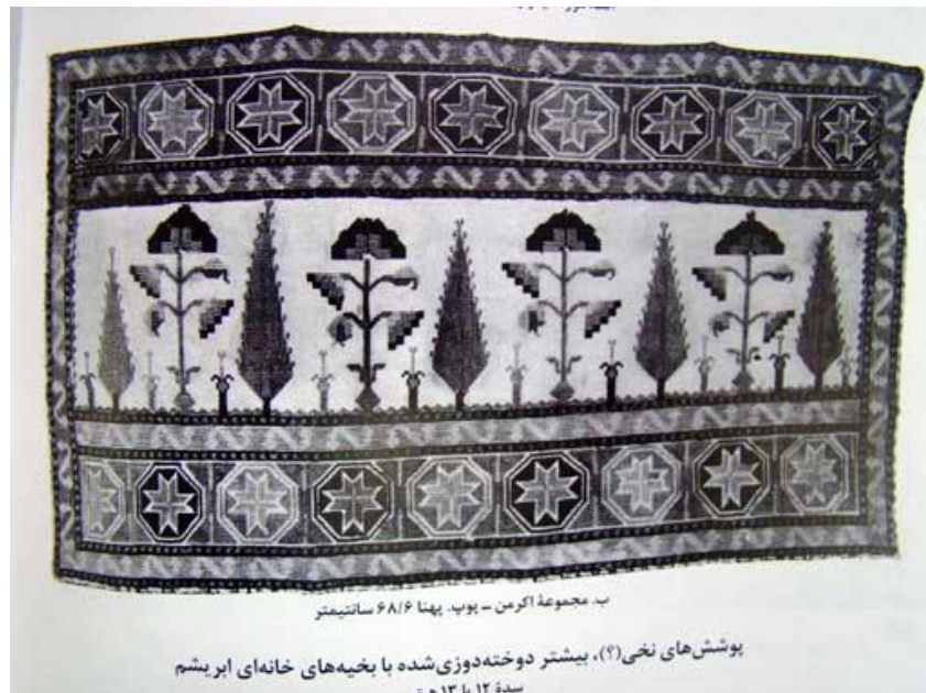
تصویر ۱۲ نمونه پارچه با نقش سرو (سیری در هنر ایران، ص ۱۱۰۲)