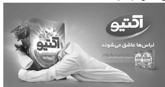
د) تبلیغ پودر رختشویی