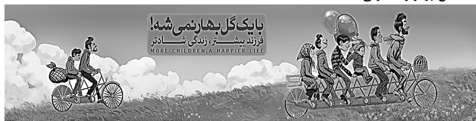
ه) تبلیغ ازدیاد نسل

۱، شما برای دعوت از والدین دانش‌آموزان دبیرستان فرهنگ برای کمک به خیریه‌ی کریم اهل بیت علیه‌السلام از چه رسانه‌ای استفاده می‌کنید؟ (فقط یک رسانه را نام ببرید)