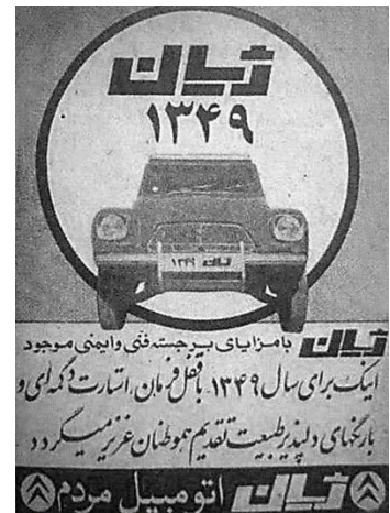
ج) تبلیغ اتومبیل