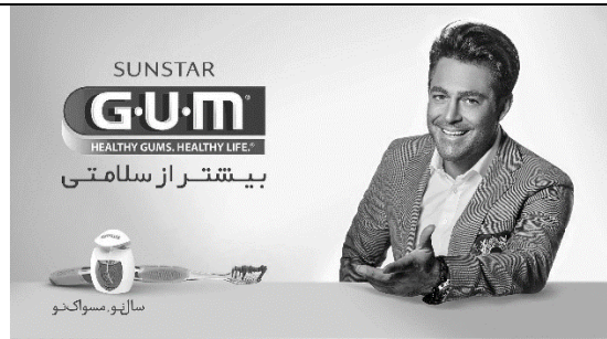
ب) تبلیغ مسواک