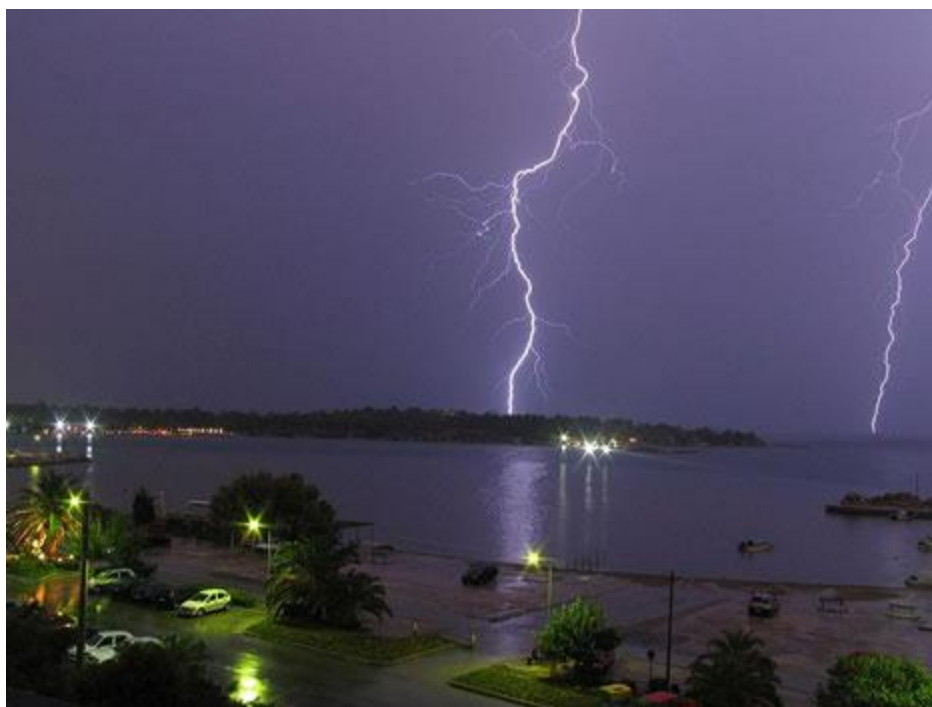
( Double lightning ۹-رعد و برق دوتائی )

رعد و برق نیروی موثر زمین است. بسیار زیبا و در عین حال بسیار خطرناک. نور سفید- آبی که در هنگام رعد و برق مشاهده می کنید بسیار گرم است. جالب است بدانید که رعد و برق خیلی گرم تر از سطح خورشید است. به نظر می رسد که رعد و برق دوتائی باید دو برابر رعد برق های دیگر ترسناک تر باشد.