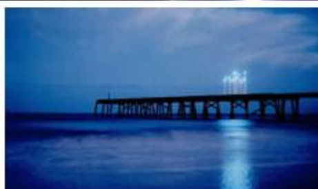
1- ST.ELMOS FIRE