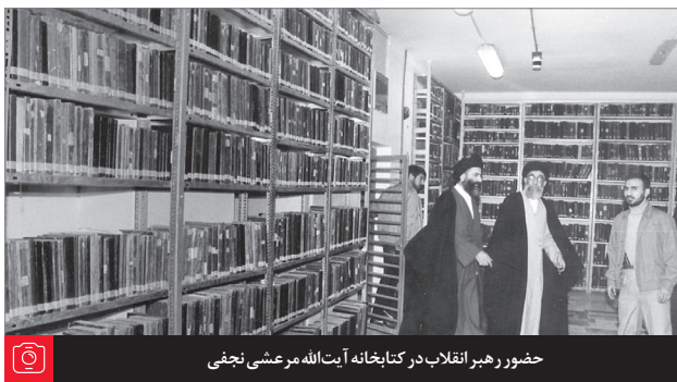
حضور رهبر انقلاب در کتابخانه آیت‌الله مرعشی نجفی

س. آیا هک کردن وای فای دیگران حرام است؟ و اگر هک کنیم باید حلالیت بگیریم؟ و در صورت لزوم حلالیت گرفتن اگر شخص را نشناسیم یا سخت پیدا شود باید چه کار کنیم؟ ج. جایز نیست و برای استفاده باید از صاحب آن رضایت بگیرد و اگر از پیدا کردن شخص مایوس هستید، قیمت مقدار مصرفی را از طرف او به فقیر صدقه دهید و احتیاط در اجازه از حاکم شرع است. ●