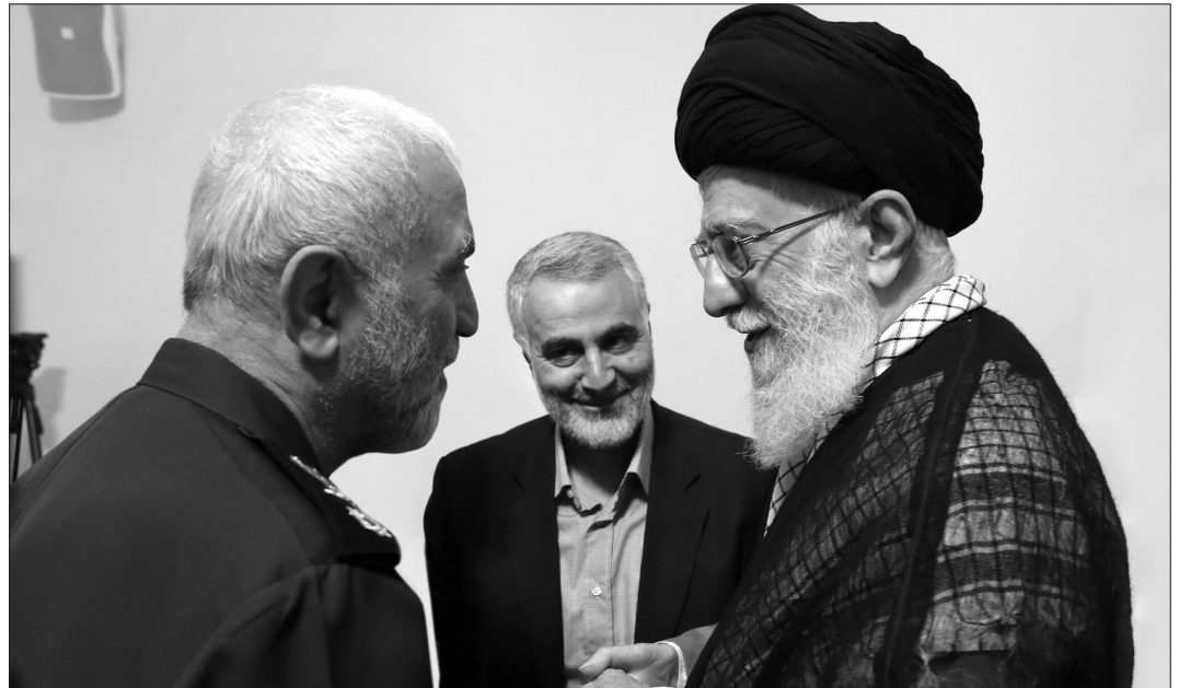
خون پاک سردار شهید حسین همدانی در راه چه هدفی بر زمین ریخته شد؟