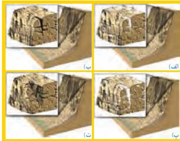
شکل ۳- مراحل هوازدگی سنگها در اثر یخ زدن آب در درزها و شکافها الف) یخزدگی و افزایش حجم ب) ذوب یخ پ) یخزدگی و افزایش حجم ت) خرد شدن سنگ