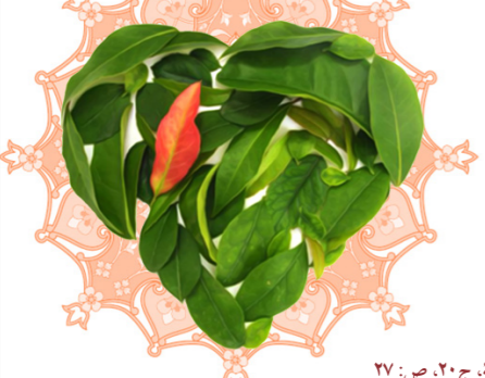
وسائل الشیعه، ج ۲۰، ص: ۲۷

جان و مال و ناموس شنیده‌اید؟ دین و راز را هم اضافه کنید و بدانید که ازدواج یعنی شراکت در همه این‌ها!