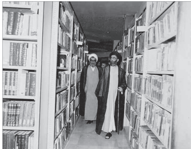
حضور آیت‌الله خامنه‌ای در کتابخانه آستان قدس رضوی، اوایل دهه ۶۰

بعضی خیال می‌کنند که مذاکره با آمریکا مشکلات کشور را حل می‌کند؛ این اشتباه بزرگی است، صدرصد اشتباه می‌کنند. طرف مقابل، نشستن ما پشت میز مذاکره و قبول مذاکره از سوی ایران را به معنای به زانو در آوردن جمهوری اسلامی می‌داند؛ می‌خواهد بگوید که ما بالاخره با فشار اقتصادی، با تحریم‌های شدید توانستیم ایران را به زانو در بیاوریم تا بایاد با ما بنشیند پشت میز مذاکره. می‌خواهد این را به دنیا تفهیم بکند، می‌خواهد اثبات کند که سیاست «فشار حداکثری» یک سیاست درستی است و این سیاست اثر کرد، جمهوری اسلامی را بالاخره آورد پای میز مذاکره نشاند؛ بعد هم هیچ امتیازی نخواهد داد؛ این را من به شما عرض می‌کنم. قطعاً و یقیناً اگر چنانچه مسئولین جمهوری اسلامی ساده‌لوحی می‌کردند و می‌رفتند می‌نشستند که با مسئولین آمریکایی مذاکره کنند، هیچ چیز گیرشان نمی‌آید؛ نه از تحریم‌ها کم می‌شود، نه از فشارها کم می‌شود. ● ۹۸/۸/۱۲