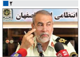
فرمانده انتظامی استان اصفهان: امنیت مردم، خط قرمز پلیس است