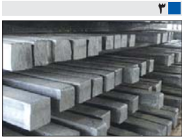
توسعه سید محصولات فولاد مبارکه با هدف گزاری تولید بیلت و بوم