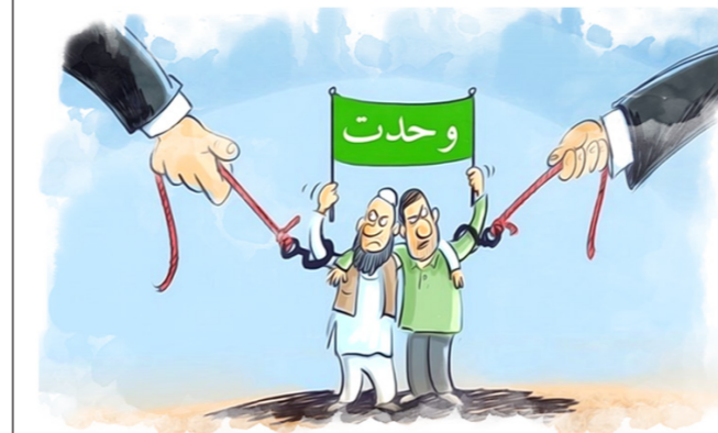
(۱) دوستی و سرپرستی غیرمسلمانان بر مسلمانان (۲) دوستی و سرپرستی مسلمانان با یکدیگر کتاب ولاء و ولایت‌ها، ص ۳۵ و ۳۶

دشمنان اسلام در هر زمان سعی دارند ولاء منفی ۱ را تبدیل به اثباتی ۲ و ولاء اثباتی را تبدیل به منفی نمایند؛ یعنی همه سعی‌شان این است که روابط مسلمین با غیر مسلمین روابط صمیمانه و روابط خود مسلمانان به بهانه‌های مختلف- از آن جمله اختلافات فرقه‌ای- روابط خصمانه باشد. در عصر خود ما به وسیله اجانب در این راه فعالیت‌های فراوان صورت می‌گیرد، بودجه‌های کلان مصرف می‌گردد و متأسفانه در میان مسلمانان عناصری به وجود آورده‌اند که کاری جز این ندارند که ولاء نفیی اسلامی را تبدیل به اثباتی و ولاء اثباتی اسلامی را تبدیل به نفیی نمایند. این بزرگ‌ترین ضربتی است که این نابکاران بر پیغمبر اکرم صلی الله علیه و آله وارد می‌سازند.