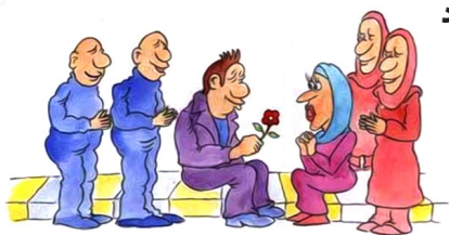
وسائل الشیعه، ج ۲۰، ص: ۹۸

امام کاظم علیه السلام : همانا خدا در کتابش امر به طلاق کرد و تأکید فرمود که طلاق باید با دو شاهد باشد و راضی نشد مگر اینکه آن دو شاهد عادل باشند. و نیز در کتابش امر به ازدواج کرد و از شاهد گذشت. اما شما در چیزی که خدا گذشته، دو شاهد محکم گرفتید و آن دو شاهدی که در طلاق خدا واجب کرده بود را باطل کردید!