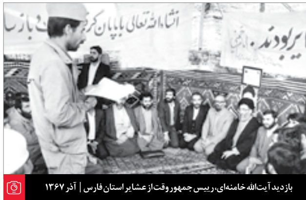
بازدید آیت‌الله خامنه‌ای، رئیس‌جمهور وقت از عشایر استان فارس | آذر ۱۳۶۷

مستندان باشد. لکن آنهایی که در بین همین جامعه بزرگ شده‌اند و احساس کردند فقر چی است، دیدند، چشیدند فقر را، احساس می‌کردند، ملموسشان بوده است که فقر یعنی چه، اینها می‌توانند به حال فقرا برسند. کوشش کنیم که این