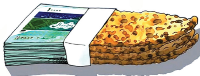
سوره مطففین، آیه ۲۹ و ۳۴

همانا مجرمان [کم‌فروشان] به مؤمنان می‌خندیدند... پس امروز که روز جزاست، مؤمنان به کافران می‌خندند.