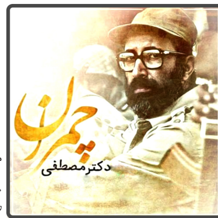
دکتر مصطفی چمران

منبع: منبرک ۳۱ خرداد، شهادت سردار رشید اسلام «دکتر مصطفی چمران» در دهلاویه (۱۳۶۰ ش) روز سیبج اساتید