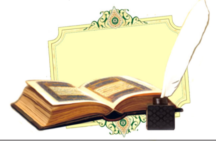
۱. حجر، ۹ ۲. بقره، ۲۳

این دیگر رد نخور ندارد، هر که مرد مبارزه است بسم الله!