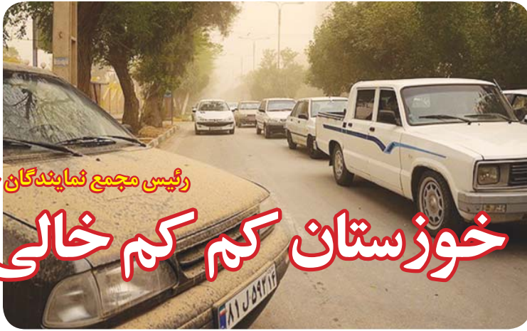
رئیس مجمع نمایندگان خوزستان؛