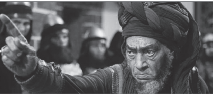
خوارچ را بشناسید

«خوارچ» را درست ترجمه نمی‌کنند. من می‌بینم که متأسفانه در صحبت و شعر و سخنرانی و فیلم و همه چیز، خوارچ را به خشکه‌مقدس‌ها تعبیر می‌کنند. این، غلط است. خشکه‌مقدس کدام است؟! اگر می‌خواهید خوارچ را بشناسید، نمونه‌اش را من در زمان خودمان به شما معرفی می‌کنم. گروه منافقین که یادتان هست؟! آیه‌ی قرآن، خطبه‌ی نهج‌البلاغه می‌خواندند، ادعای دینداری می‌کردند، خودشان را از همه مسلمان تر و انقلابی‌تر می‌دانستند؛ آن وقت بمب‌گذاری می‌کردند و ناگهان یک خانواده، بزرگ و کوچک و بچه و صغیر و همه کس را به هنگام افطار ماه رمضان می‌کشتند! چرا؟! چون اعضای آن خانواده طرفدار امام و انقلاب بودند… خوارچ، اینها بودند. عبدالله‌بن‌خباب‌رامی‌کشند؛شکم‌عیاالش‌را که حامله بود، می‌شکافتند، جنین او را هم که یک جنین مثلاًچند ماهه