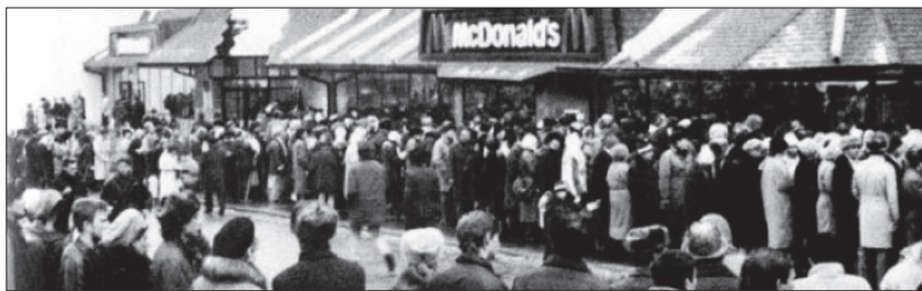
نمایی از صف هفت کیلومتری مردم مسکو برای خرید از رستوران مک‌دونالد؛ مدتی قبل از فروپاشی شوروی