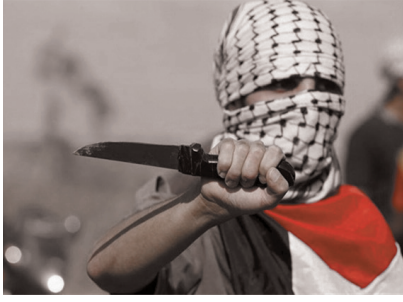
عکس ۳ / انتفاضه سوم فلسطین