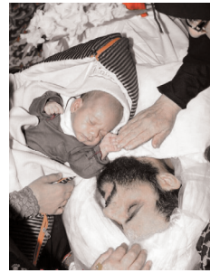
عکس ۲ / وداع فرزند شهید مدافع حرم با پیکر پدر شهیدش