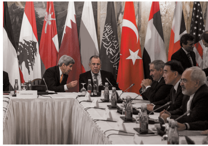
عکس ۱ / مذاکرات بر سر محور مقاومت بدون حضور نماینده‌ای از سوریه

عکس نوشته‌های خود را در رابطه با تصاویر به صفحه تلگرام فتح به شماره ۰۹۱۰۴۹۷۰۶۲۵ و یا رایانامه fath@basijisu.ir ارسال نمایید. بهترین عکس‌نوشته‌ها در شماره بعدی فتح منتشر خواهد شد.