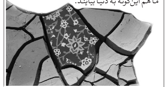
(الأمالی للطوسی، ص: ۲۹۹)

شیعیان ما جزئی از ما هستند. از اضافی خاک ما خلق شدند. آن‌چه ما را ناراحت می‌کند، آن‌ها را ناراحت می‌کند و آن‌چه ما را شاد می‌کند، آنان را شاد می‌کند. خوش به حال ما که پدر و مادرهای نازنینمان با عشق اهل بیت به دنیا آوردندمان. ان شاء الله فرزندان ما هم این‌گونه به دنیا بیایند.