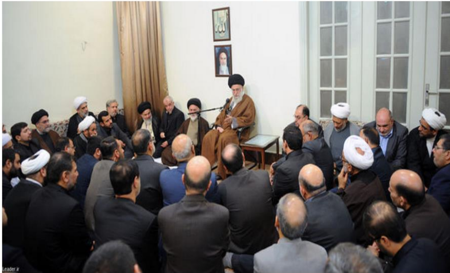
دیدار مسئولان و دست‌اندرکاران حج