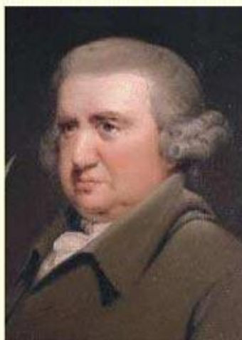
Portrait detail by Joseph Wright of Derby; original at Darwin College, Cambridge.