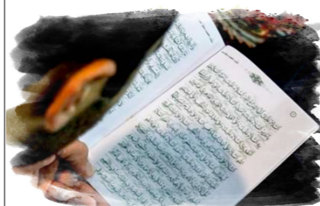
فرازهایی از زیارت حضرت رسول اکرم ﷺ مفاتیح الجنان

آنکه در مسابقه بندگی بر همه پیروز آمد و کسی در این مسابقه به او ملحق نشود