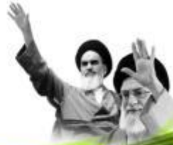
شهید گرانقدر عین اله امینی (علی)