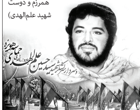
عبدالکریم حسینی معاون مدیرکل فرهنگ و ارشاد اسلامی تهران