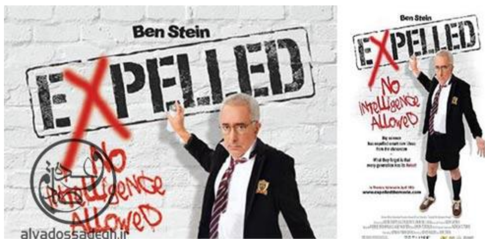
فیلم مستند « اخراج شده » یا

اما در این میان، یکی از فیلم های مستندی که توجه بسیاری از مخاطبان را به خود جلب نمود و افراد متعددی را در داخل و خارج کشور به سمت خود جذب کرد، فیلم مستند « اخراج شده» یا « Expelled: No Intelligence Allowed » بود که برنده ی جوایزی همچون «جایزه ی آزادی بیان » در سال ۲۰۰۸ میلادی گردید(۱) و در بیست و هشتمین دوره ی جشنواره ی فیلم فجر (سال ۱۳۸۸ شمسی) نیز شرکت نمود.(۲)