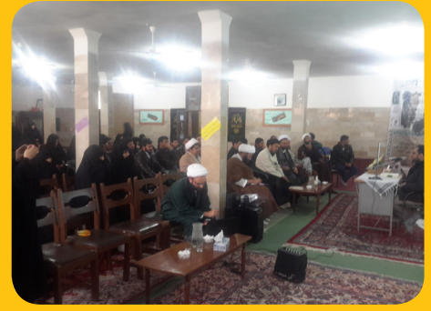
مدرسه علمیه الزهرا س - روستای چمن آباد خواف