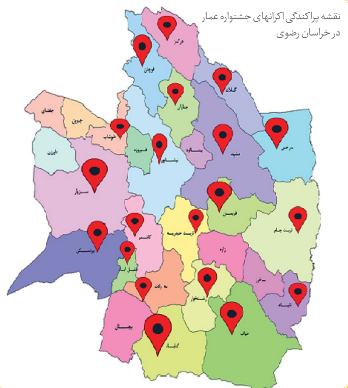
نقشه پراکندگی اکرانهای جشنواره عمار در خراسان رضوی

شماره‌های بعدی در اختیار سایر استان‌ها قرار گیرد. با تشکر