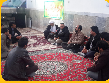
در جمع رابطان اکران - شهر سلامی