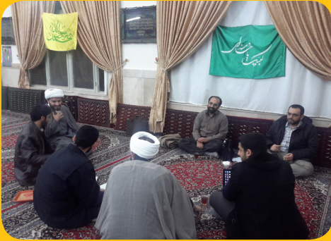
در جمع رابطان اکران - تربت حیدریه