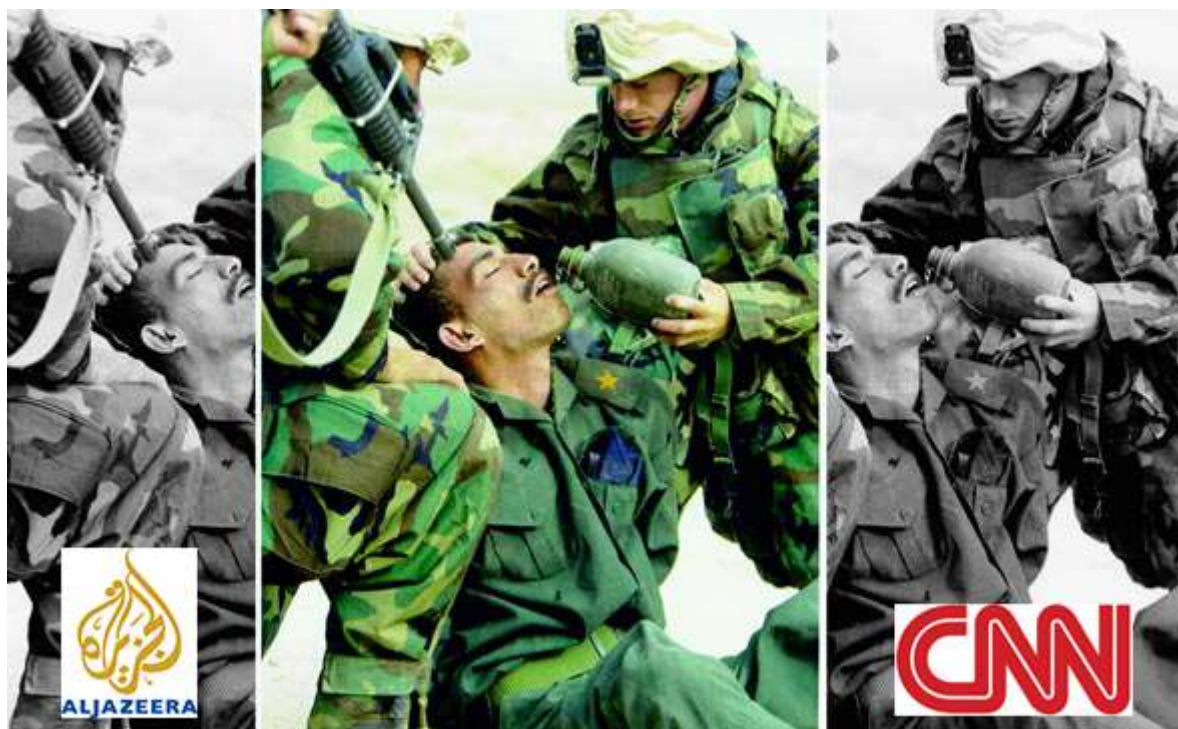
جریان های خبری رسانه های مختلف و نحوه ارائه اخبار

این روزها اگر اخبار جنگ سوریه را در سایتهای مختلف دنبال کنید، پاسخ های عجیب و غریب و جالبی می بینید. مثلا، در زبان فارسی تیتراژی خبری سایتهایی همچون بالاترین به دلیل تم مخالفت با نظام ایران، معمولا به صورت دشمنی با ایران هم هست. پس در این سایت ادم بد جریان ایران و سوریه است. مردم در سوریه دارند نسل کشی می شوند و ایرانی ها و ارتش سوریه دارند برای صبحانه مردم سوریه را شکار، کباب کرده و نوش جان میکنند.