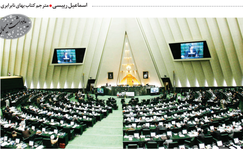
اسماعیل ریسی • مترجم کتاب بهای نابرابری