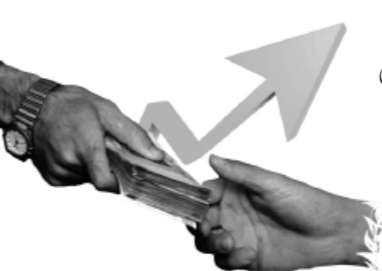
تورم را محاسبه کنید

رساله آموزشی آیت‌الله‌العظمی‌خامنه‌ای، بخش ربای در قرض