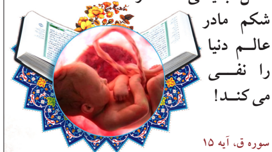
سوره ق، آیه ۱۵

خلاصه‌اش این که خلق دوم قطعاً ساده‌تر از خلق اول است، چرا درباره خلق اول شبهه نمی‌کنند؟ چون نمی‌توانند آن را انکار کنند! اما خلق دوم را که معاد است رد می‌کنند که چون کاری ندارد!