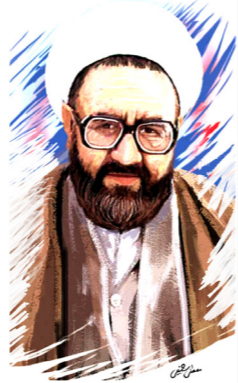
منبع: منبرک علامه شهید مرتضی مطهری

یکی از شاگردان ایشان می‌گوید: احترام عجیبی به استادانش می‌گذاشت تا جایی که به یکی از استادانش که از نظر خط فکری در مسیر انقلاب با او همراه نبود نیز احترام می‌گذاشت. من گفتم: شما با ایشان در ارتباط هستید و به ایشان این قدر احترام می‌نمایید؟! در جواب فرمود: «ایشان حق استادی گردن من دارد.»