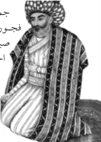
لامحمدتقی پدر محمدباقر مجلسی بر اساس: خبرگزاری فارس

جمع حاضر که جملگی از اهل فسق و فجور بودند، به فکر فرو رفتند و رئیس آن‌ها صبح روز بعد غسل توبه کرد و آمد تا احکام شرعی را از علامه بیاموزد.