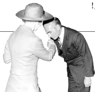
محمدرضا پهلوی در حال بوسیدن دست همسر یکی از مقامات بلندپایه خارجی شرکت کننده در مراسم جشن‌های ۲۵۰۰ ساله شاهنشاهی در پاسارگاد.

راستی بد نیست چندتایی از این‌ها را حفظ کنیم که هر وقت کسی حرف بی‌خود زد، از نظام اسلامی که پاره‌تر مان است دفاع کنیم. چون‌که بعضی از آن‌ها برای ننگ تاریخ بس است. مثلاً همین کاپیتولاسیون... وای!