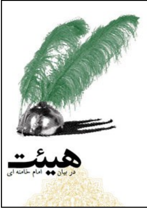
جزوه اهل مودت