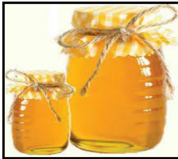
✓ عسل مصنوعی