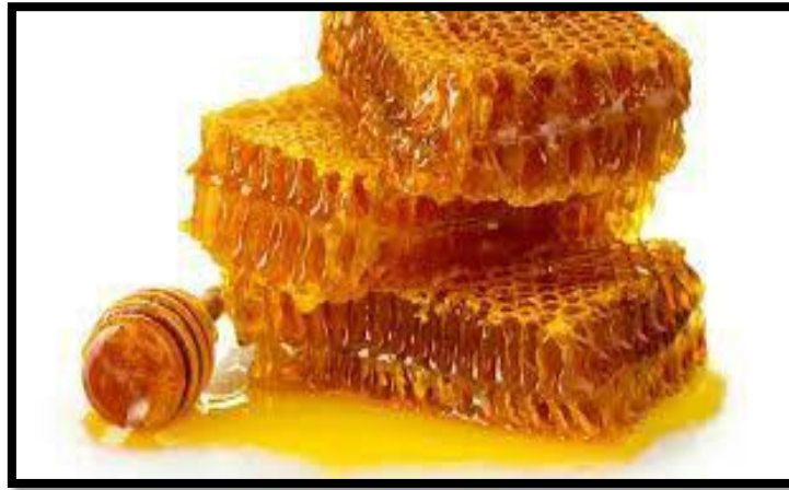
✓ عسل طبیعی