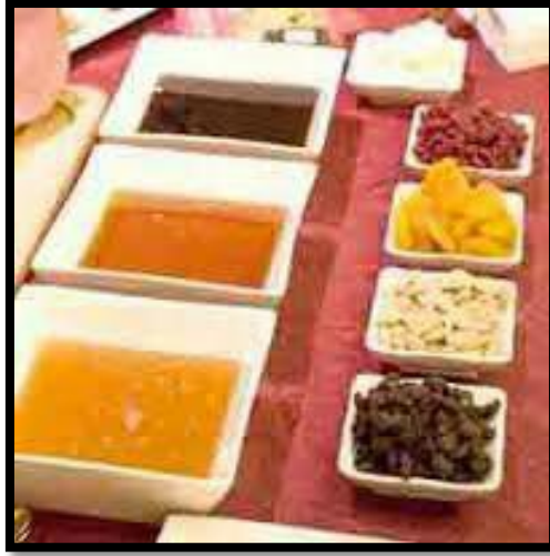
✓ عسل با موم