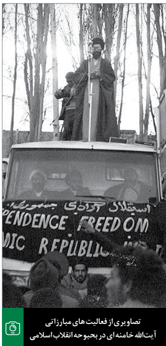
تصاویری از فعالیت‌های مبارزاتی آیت‌الله خامنه‌ای در محبوحه انقلاب اسلامی

مهم ترین کار اصولی‌ای که انقلاب کرده است، تبدیل نظام طاغوت سالار به نظام مردم سالار است؛ این مهم ترین کاری است که انقلاب کرده است؛ آن هم با الهام از تعالیم اسلامی، نه با مکتب‌های این نظریه پرداز و آن نظریه پرداز و نقص‌ها و معارضاتی که در حرف‌ها نشان هست؛ نه، با الهام از اسلام، با الهام از قرآن. اَلَّذِیْنَ ءَامَنُوا یَقَاتِلُونَ فِی سَبِیْلِ اللّٰهِ وَ اَلَّذِیْنَ کَفَرُوا یَقَاتِلُونَ فِی سَبِیْلِ الطَّاغُوتِ؛ نظام الهی در مقابل نظام طاغوتی است و جمهوری اسلامی و انقلاب اسلامی، نظام الهی را معنا کرد به نظام مردم سالاری دینی؛ جمهوری اسلامی یعنی این؛ تبدیل کرد نظام طاغوتی را به نظام مردم سالار؛ این مهم ترین کار است. ● ۹۶/۱۱/۲۹