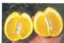
نامتقارن شدن میوه