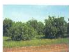
کوتولگی درخت آلوده

این بیماری با پیوندک و قلمه گیاهان آلوده به راحتی منتقل میشود ولی در خصوص انتقال بصورت مکانیکی و از طریق بذر گزارشی ارایه نشده است. همچنین این بیماری از طریق زنجره‌ها از درختان آلوده به درختان سالم سرایت میکند. در ایران ناقله‌های آن Neoaliturus tenellus و Neoaliturus haematoceps میباشد. این بیماری از طریق ارقام وارداتی آلوده وارد کشور شده و امروزه در اکثر باغات کشور گسترش یافته است.