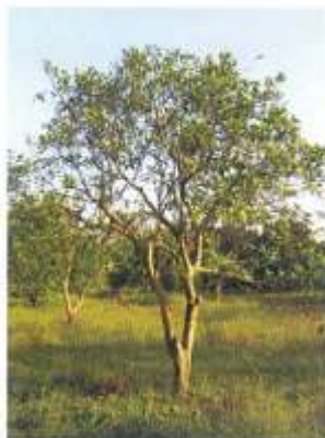
درخت مرکبات آلوده به نماتد Tylenchulus semipenetrans .

علائم ناشی از حمله نماتد در قسمت‌های هوایی درختهای مرکبات شامل ضعف عمومی، علائم کمبودهای غذایی، زردی و ریزش برگها خصوصاً در شاخه‌های انتهایی میباشد. در درخت‌های آلوده برگها از سبز خاکستری تا زرد کم‌رنگ شده و درخت در اثر ریزش برگها خشکیده و به تدریج زوال مییابند. ریشه‌های جوان رشد طبیعی نداشته و ضخیم‌تر بنظر می‌رسند. نماتد ماده از خود ماده چسبنده ژلاتینی ترشح می‌کند که این ترشحات باعث چسبیدن خاک به ریشه شده و در اثر قرار دادن ریشه در آب، خاک آن به آسانی شسته نمی‌شود. در صورت شدت بیماری رشد سیستم ریشه کم می‌شود. ریشه‌ها رنگ طبیعی خود را از دست داده و پوست آنها به سهولت از محور مرکزی جدا می‌گردد. میوه درختهای آلوده اغلب کوچک و از نظر کمی و کیفی کاهش یافته و به مرور می‌ریزند. رشد نهال‌های آلوده ۴۰ تا ۵۰ درصد کمتر از نهال‌های سالم است.