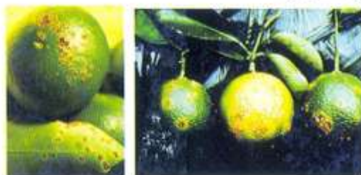
زخمهای ناشی از بیماری بر روی میوه

بیماری در کیفیت میوه تغییری ایجاد نمیکند اما بازار پسندی آن کاهش می یابد. آلودگی شدید باعث خشکیدگی سرشاخه ها و موجب ریزش برگها و میوه های آلوده میشود.