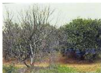
زوال درختان مرکبات توسط ویروس ترپستزا

اولین اپیدمی بزرگ ترپستزا در آرژانتین و برزیل اتفاق افتاد. این بیماری همراه با نهال های پیوندی نارنگی انشوی زودرس از ژاپن وارد ایران (باغ مهدشت ساری) گردید و پس از گذشت ۳۰ سال انتشار آن به وسیله شته سبز جالیز در شرق مازندران گزارش شده است.