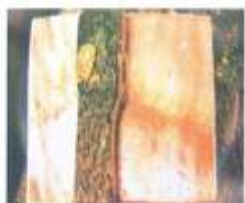
علائم لانه زنبوری معکوس در محل پیوند