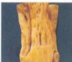
علائم ساقه آبله‌ای روی لیمو ترش