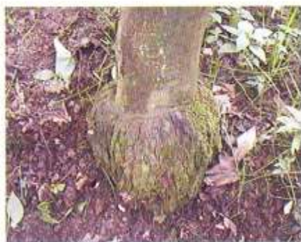
علائم پوسته پوسته شدن روی پایه (پونسایروس) در درخت مبتلا به اگروکورتیس

برخی دیگر از ارقام نظیر لیمو شیرین، لمون و بالنگ نیز به این بیماری حساسند ولی شدت علائم تنه در آنها خفیف تر است. اگر ارقام آلوده به بیماری روی پایه های متحمل پیوند شوند، ممکن است حالت پا کوتاهی و کاهش رشد درخت مشاهده گردد. در هر صورت عامل بیماری در چنین ارقامی (حتی بدون وجود علائم) قادر به تکثیر بوده و میتواند به عنوان منابع آلودگی عمل نماید. شناسایی بیماری با ایندکس بر روی گیاهان محک امکانپذیر میباشد.