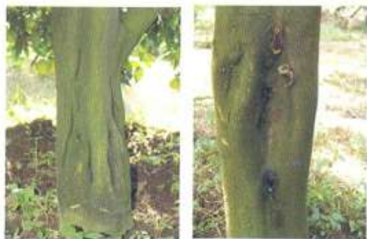
فرورفتگیهای روی تنه در درختان آلوده

در درختان آلوده ارقام حساس (پرتقال تامسون ناول، نارنگی و تانجلو) وجود حفرات طولی با ابعاد مختلف روی تنه و شاخه ها همراه با ترشح صمغ و ضعف عمومی درخت به همراه خشکیدگی مشاهده میگردد و در وضعیت شدید زوال و مرگ درختان را موجب میگردد. در حالتیکه تعداد حفرات زیاد باشد باعث تغییر شکل تنه و شاخه ها میشود. در بعضی شرایط ترشح صمغ از سطح پوست در لبه یا وسط فرورفتگی یا شکافهای اطراف دیده میشود. روی برگهای جوان علامه نقش برگ بلوطی در شرایط خنک سال (بهار و پاییز) ظاهر میگردد که با گرم شدن هوا و کامل شدن برگها این علامه محو میشود.