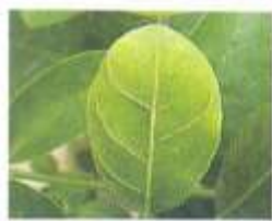
علائم بیماری روی لیمو ترش (گیاه محک)

برخی از نژادهای عامل بیماری ایجاد علائم ساقه آبله ای مینماید که در آن فرورفتگیها یا شیارهای ریز یا طویل در روی چوب سرشاخه ها، شاخه و تنه درختان آلوده به وجود می‌آید که با برداشتن پوست این قسمت‌ها قابل رویت است.