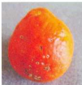
علائم بیماری روی میوه تانجولو

آلودگی میوه ها معمولاً بصورت سطحی بوده، ولی با نفوذ قارچ به بافت میزبان موجب ریزش آنها میگردد. میوه های باقیمانده دارای علائم روی درخت دارای خاصیت بازار پسندی پایین میباشند. جوشهای ایجاد شده به آسانی از روی پوست میوه جدا شده و میریزند و حالت آبله ای به آن میدهد.