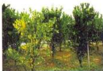
زردی و کمی رشد درخت آلوده در مقایسه با شاهد

علائم در درختان آلوده به صورت سرخشیدگی، کوتولگی، ریزبرگی، حالت موزاییکی و علائم مشابه کمبود روی، کاهش اندازه میوه، سبز ماندن قسمتی از میوه (معمولا گلگاه)، بدشکلی، ریزش برگ و میوه، چروک و عقیم شدن بذور می‌باشد. عامل بیماری توسط پیوندک آلوده و پسپل منتقل می‌شود.