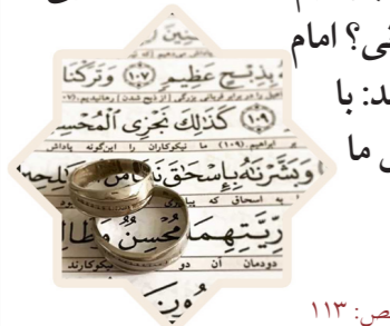
وسائل الشیعه، ج ۲۰، طبع: ۱۱۳

راستی چطور بفهمیم که نطفه‌مان خدایی است یا شیطانی؟ امام جواب می دهد: با محبت یا بغض ما اهل بیت.