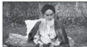
حزب الله (ع) این است