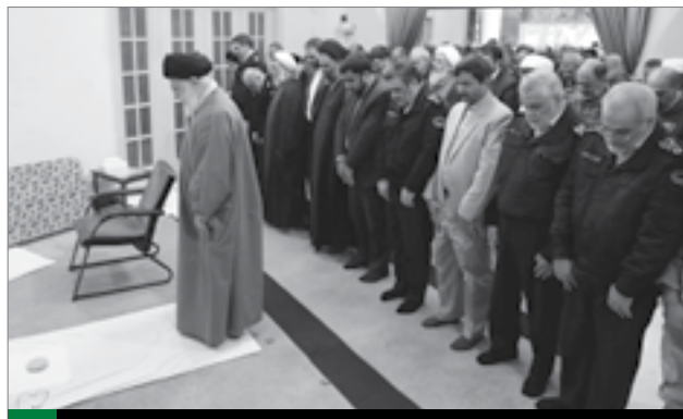
دیدار فرماندهان ناچا با رهبر معظم انقلاب اسلامی | ۹۷/۸/۲۷

غصه می‌خورد. در آیه‌ی شریفه هست که: مثل اینکه می‌خواهی خودت را هلاک کنی برای اینها. می‌خواست که همه‌ی عالم به نور برسند. مبعوث شده بود برای اینکه همه‌ی این هیاهوهای