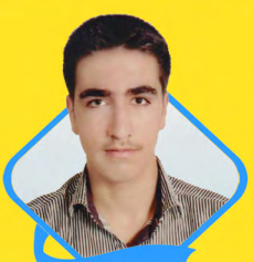
حسین نعمت الهی