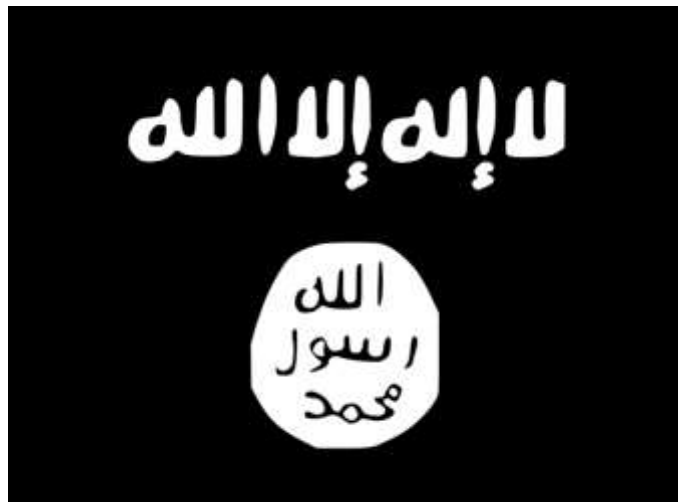
تصویر ۱ پرچم گروه تروریستی داعش

گروه از زمان تشکیلش در سال ۲۰۰۴ که با نام جماعت آل توحید و جهاد تشکیل شد تا به امروز از اسامی مختلفی استفاده کرده است. در اکتبر ۲۰۰۴، رهبر گروه، ابو موصب الزرقاوی برای بن لادن سوگند وفاداری یاد کرد، بعد نام گروه را به تنظیم قادات الجهاد فی البلاد الرافضین، سازمان جهاد در بین کشور دو رودخانه، یا القائده عراق تغییر داد. در سال ۲۰۰۶ گروه با چند گروه جهادی عراقی کوچکتر ادغام شد و به زیر چتر حمایتی مجلس شورای مجاهدین رفت. در ۱۲ اکتبر ۲۰۰۶، مجلس شورای مجاهدین با چهار گروه شبه نظامی و نمایندگان برخی از طایفه های عراقی در گروهی به نام خلاف المتیبین عضو شد که روز بعد به عنوان دولت اسلامی عراق معرفی شد. در آوریل ۲۰۱۳، پس از ورود گروه به سوریه، نام را به دولت اسلامی عراق و شام تغییر داد. اگرچه سازمان هیچوقت از اسم القائده ی عراق برای خود استفاده نکرده است، اما این اسم توسط بسیاری از نیروهای خارجی اش مورد استفاده قرار گرفته است.