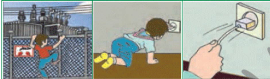
دستکاری پریز توسط نوزادان بیرون کشیدن پریز از طریق سیم