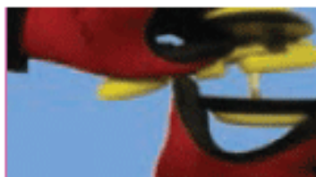
ت - اتصال چرخ دوم

شکل ۱۷-۳ - مراحل مونتاژ برخی قطعات اسباب بازی