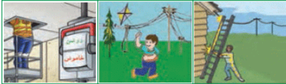
اتصال جسم هادی با برق و برق گرفتگی خاموش نبودن کلید اصلی