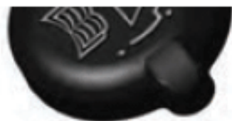
شکل ۴-۸- در رادیاتور

مسر پسیمن آب جوس و سوسسی سدیم وجود در رادیاتور