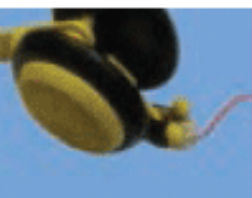
ج - مونتاژ کامل قطعات