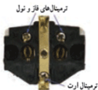
ب- بریز ارت دار