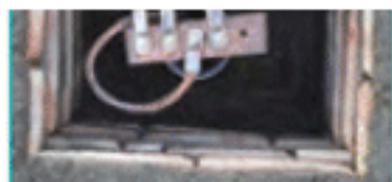
الف- جاء ارت

حایق در پست، از وصل به هادی حملی ارت (معاد خواهد بود.