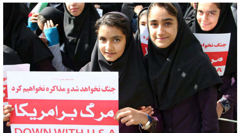
۱۳ آبان ۱۳۹۷ | سعادت شهر

اینک در آستانه چهل سالگی انقلاب بار دیگر در تقابلی عزتمدارانه، ملت بزرگ ایران در جنگ نابرابر اقتصادی با تمام توان به میدان آمده است تا با اتکاء به خداوند سبحان این قدرت رو به زوال را از صحنه روزگار محو کند و شر جریان