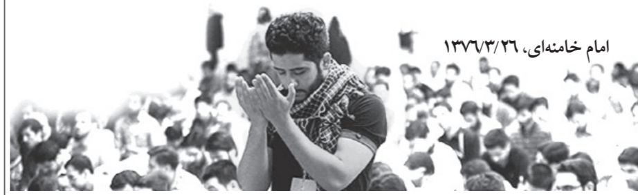
امام خامنه‌ای، ۱۳۷۳/۲۶

پوستین‌های وارونه مد شده بود و جوانان، آن را می‌پوشیدند. یک روز دیدم جوانی که از این پوستین‌های وارونه پوشیده، صف اول نماز در پشت سجاده من نشسته است؛ یک حاجی محترم بازاری هم که مرد خیلی فهمیده‌ای بود، در کنار این جوان نشسته بود. دیدم رویش را به این جوان کرد و چیزی در گوشش گفت و این جوان یک‌باره مضطرب شد. برگشتم به آن حاجی محترم گفتم چه گفتی؟ به جای او جوان گفت چیزی نیست. فهمیدم که این آقا به او گفته که مناسب نیست شما با این لباس در صف اول بنشینید! گفتم نه آقا، اتفاقاً مناسب است شما همین‌جا بنشینید و تکان نخورید! گفتم حاجی! چرا می‌گویی این جوان عقب برود؟ بگذار بدانند که جوان با لباسی از جنس پوستین وارونه هم می‌تواند بیاید به ما اقتدا کند و نماز جماعت بخواند... با اخلاق، سراغ این جوانان و دل‌ها و روح‌ها و ورای قالب‌هاشان بروید؛ آن وقت تبلیغ انجام خواهد شد.