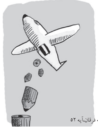
سوره مبارکه فرقان، آیه ۵۲

پس از کافران اطاعت نکن و به وسیله آن (اطاعت نکردن) با آنها جهاد بزرگ کن! پس آنها که فکر می‌کنند تا جنگ رود رو پیش نیامده، می‌توانند خوش باشند، بدانند که سخت در اشتباه هستند؛ الان دوران جهاد کبیر و اکبر است که متأسفانه خیلی‌ها در آن شکست می‌خورند.