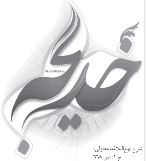
شرح نهج البلاغه، معتزلی، ج ۱: ص ۶۸

چه خوب است که هم قرآن را خوب بخوانیم و هم با بزرگانی چون ام‌المؤمنین خدیجه آشنا شویم.