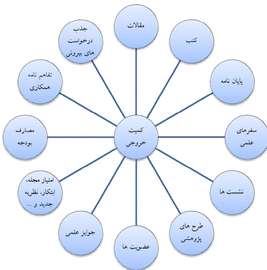
شکل شماره ۲: مدل شاخص‌های کمی ارزیابی عملکرد پژوهشی در حوزه خروجی

در حوزه کمیت خروجی ۱۱ شاخص را مشاهده می‌کنیم. البته از جهت ارزیابی کارایی هزینه‌ها، در شکل شماره ۲ شاخص کمی مصارف بودجه را نیز به عنوان شاخص دوازدهم اضافه نموده ایم