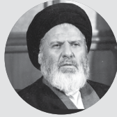
آقای موسوی اردبیلی: