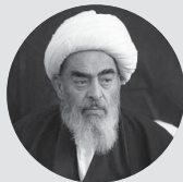
آقای فاضل لنکرانی: امام شما را صاحب نظر می‌دانستند