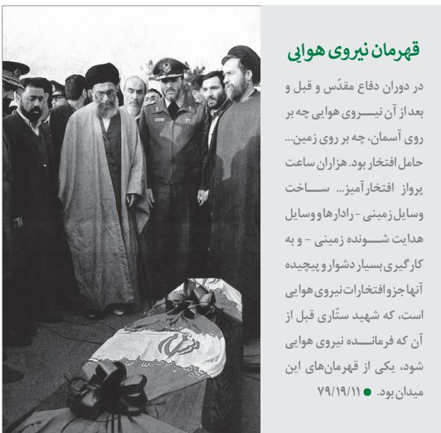
حضور رهبر انقلاب در مراسم تشییع جمعی از فرماندهان نیروی هوایی | ۲۳/۱۰/۱۸

واقعیت‌هایی وجود دارد که اگر ما این واقعیت‌ها را در محاسبات خودمان نیاوریم، قطعاً در قضاوت اشتباه خواهیم کرد؛ در انتخاب راه هم اشتباه خواهیم کرد. این واقعیت‌ها را باید دید... ما وقتی که می‌خواهیم آرمان‌گرایی همراه با واقع‌بینی داشته باشیم - یعنی واقعیت‌ها را ببینیم، بر اساس واقعیت‌ها حرکت خودمان را تنظیم کنیم - باید توجه کنیم که به لغزش‌هایی که در اینجا ممکن است پیش بیاید، دچار نشویم. لغزشگاه‌هایی وجود دارد... یک لغزش... این است که ما بخشی از واقعیت‌ها را ببینیم، بخش دیگری از واقعیت‌ها را نبینیم؛ این هم موجب خطاست؛ خطای در محاسبه‌ی راه دنبال خواهد داشت. واقعیت‌ها را باید با هم دید و دانست. ● ۹۷/۵/۳