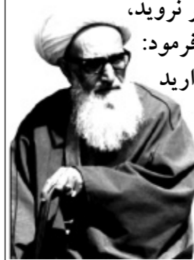
منبع: پایگاه اطلاع‌رسانی حوزه ۱۲ مهرماه ۱۳۶۱ - شهادت عالم مجاهد «عطاءالله اشرفی اصفهانی» پنجمین شهید محراب در باختران

خطبه‌های پرشور شهید اشرفی اصفهانی، در پیش‌برد انقلاب و ادامه جنگ تحمیلی و دفاع مقدس فوق‌العاده مؤثر بود. وی علاوه بر تشویق جوانان در عزیمت به جبهه‌های دفاع مقدس و دعوت مردم برای کمک به جبهه‌ها، خود نیز عملاً مدافع و مجاهد بود. ایشان به رغم کهولت، چندین بار در جبهه‌های نبرد حاضر شد. وقتی می‌گفتند شما جلوتر نروید، چون ممکن است دشمن ببیند و حادثه‌ای رخ دهد، می‌فرمود: «خون من که از خون این بچه‌ها بالاتر نیست، بگذارید شاید من هم در جبهه‌ها شهادت نصیبم گردد، شاید آن چیزی که سال‌هاست به دنبال آن هستم، در جبهه‌ها پیدا کنم».