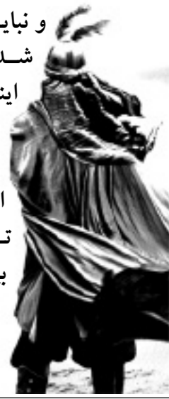
سوره مبارکه آل عمران، آیه ۱۷۸

و نباید کسانی که کافر شده‌اند تصور کنند اینکه به ایشان مهلت می‌دهیم برای آنان نیکوست، ما فقط به ایشان مهلت می‌دهیم تا بر گناه [خود] بیفزایند.