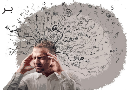
(۱) امام خامنه‌ای، ۱۳۷۵/۰۶/۰۶

بر اینکه خیلی اوقات کار هم غلط و همراه با ضایعه انجام می‌گیرد.