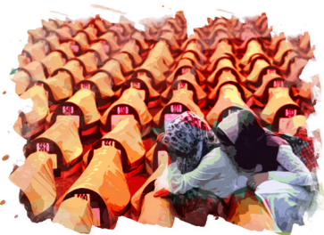
۱۱ ژوئیه، کشتار وحشیانه مردم مسلمان بوسنی به دست نیروهای ارتش صربستان

این کشتار، بار دیگر پوشالی بودن سازمان‌های بین‌المللی را به رخ همگان کشید. و مشخص شد که مسئولان این سازمان‌ها، مزدبگیران همان ابرقدرت‌ها هستند. از طرفی، از صدر اسلام تاکنون، ظلم‌های متعددی به مسلمانان در سراسر جهان شده است. و این خود نشانه‌ای از برحق بودن دین اسلام است؛ دینی که زورگویی‌ها را نمی‌پذیرد و بر اقامه عدل دستور داده است و سرسازش با مستکبران ندارد.