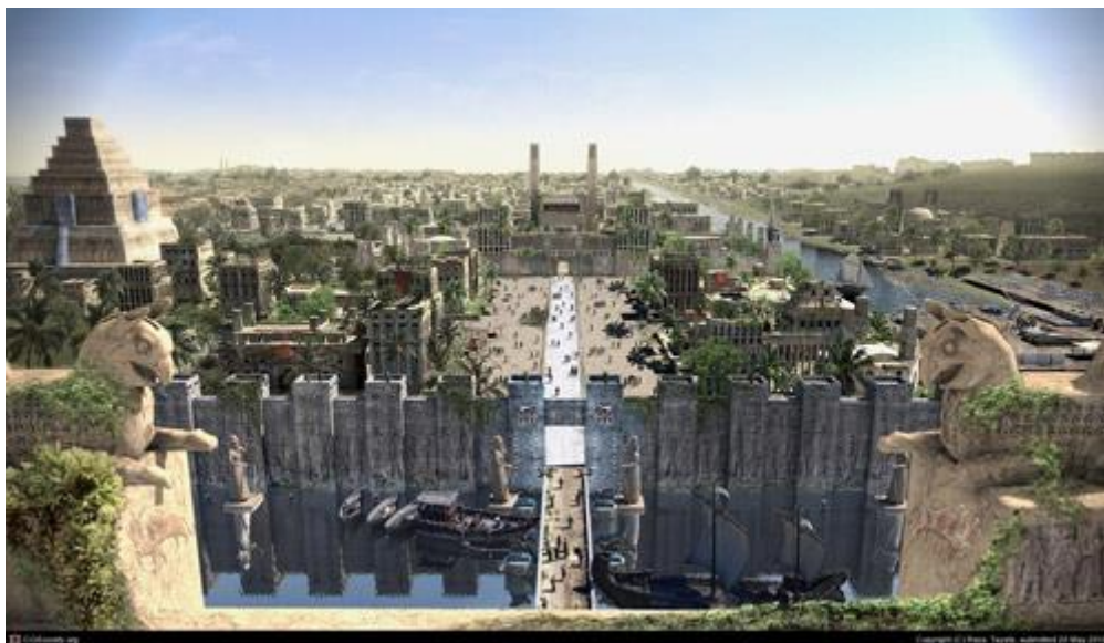
نگاره‌ای خیالی از شکوه بابل در دوران باستان