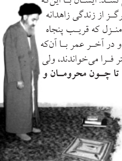
پایگاه خبرگزاری حوزه ۸ مهر ۱۳۶۹ - رحلت «آیت‌الله سید محمدصادق لواسانی»

او هر هفته بعد از انقلاب در گرما و سرما به ملاقات امام خمینی رهبر می‌رفت و این ملاقات هیچ موقع قطع نشد. ایشان با این که نماینده تامالاختیار حضرت امام بود، هرگز از زندگی زاهدانه اش دست نکشید و تا آخر در همان منزل که قریب پنجاه سال پیش خریده بود، زندگی کرد و در آخر عمر با آن که تمامی دوستانش او را به زندگی‌ای بهتر فرا می‌خواندند، ولی او با خدای خود عهد کرده بود تا چون محرومان و پابریه‌ها زندگی کند.