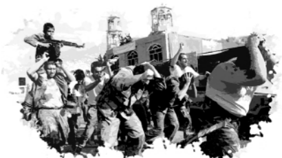
سوره مبارکه آل عمران، آیه ۶۲

همانا این همان داستان‌های حق است و هیچ خدایی جز الله نیست.